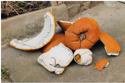
ohne Titel Eiche gefasst, 1,5 m x 1,5 m, 2014