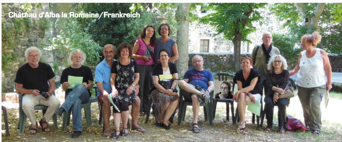
Château d'Alba la Romaine/Frankreich