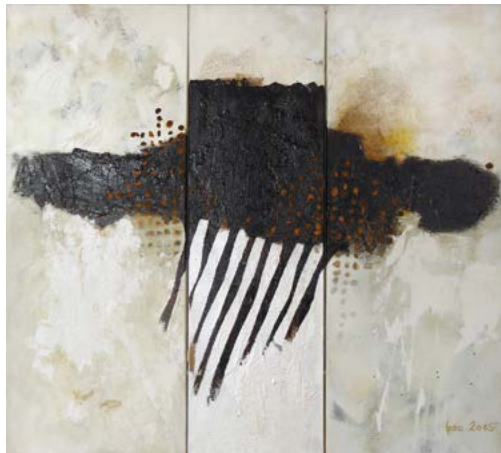
Adjena/Regen Mischtechnik, 100 x 110 cm, 2015