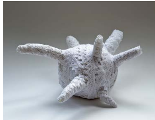
Verwicklungen 4 aus der Serie „das ist Spitze“ Beton/Spitze, 15 x 32 x 32 cm, 2014