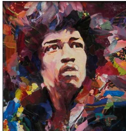
„Jimi Hendrix (dark)“ Mischtechnik, 52,2 x 50 cm, 2013